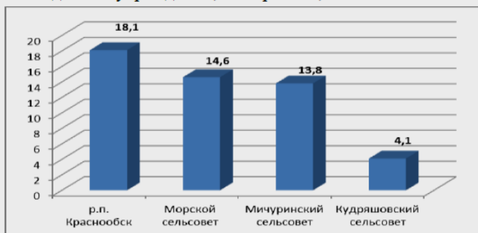
Рисунок 2. Темп прироста населения в населенных пунктах Новосибирского сельского района, 2015 г. к 2010 г., % 6

Сложное положение с образовательными учреждениями и в других населенных пунктах Новосибирской области. В ряде населённых пунктов, где проживало от 100 до 700 и более жителей, не было ни одного образовательного учреждения (таблице 1). В большинстве населенных пунктов с числом жителей менее 100 человек данных учреждений, как правило, нет.